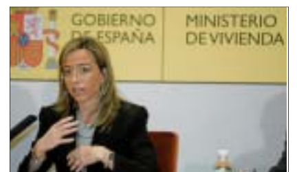
Carme Chacón, ministra de Vivienda.

Vivienda. A partir del día 2, primer laborable de enero, las comunidades y ciudades autónomas empezarán a tramitar las ayudas previstas por el Ministerio de Vivienda, dirigido por Carme Chacón, para la Renta Básica de Emancipación. Aunque el Ejecutivo ha fijado en 210 euros por persona, las cantidades para la ayuda al alquiler varían según las comunidades, ampliándose en algunas hasta jóvenes de 36 años.